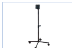
LCDS-700 対応機種： SP-185JH/SP-156JH/ SP-133EL/SP-110EW