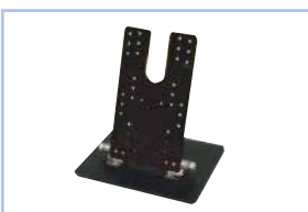
AT-T06SP 対応機種： SP-133EL/SP-110EW