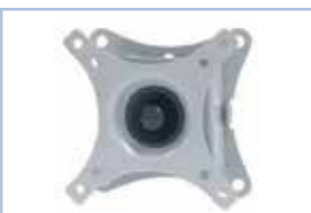
AV607T 対応機種： SP-185JH/SP-156JH/SP-133EL SP-110EW/SP-215DM