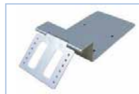
AT-T05SP 対応機種： SP-070EW/SP-070HW