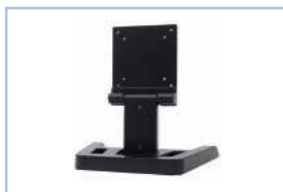
ST-A01VE 対応機種： SP-133EL/SP-110EW