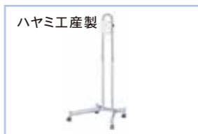
TF220 対応機種： SP-185JH/SP-156JH